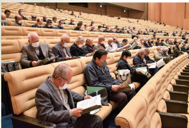
資料に目をやる総代のみなさん