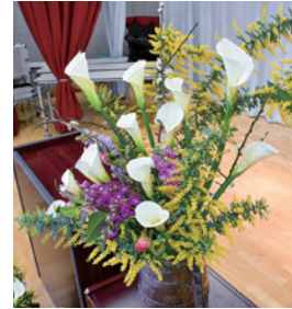
◀ 特産花きで 会場を彩り ました