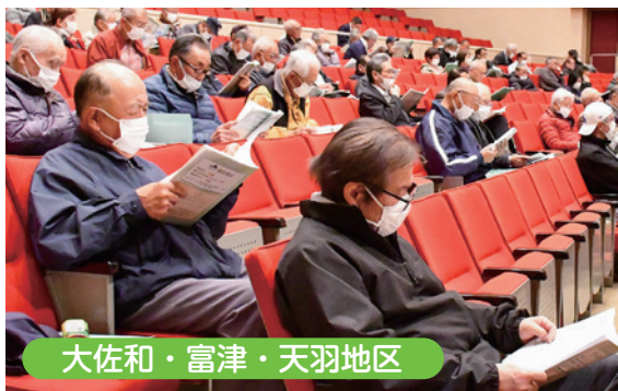
大佐和・富津・天羽地区

から毎年、当期未処分剰余金の一部を積み立ててきたもので、令和7年に8億円となりました。今回これを全額取り崩しましたが、今年度計画では黒字を見込んでいたため、毎年取り崩しが続くような懸念はありません。