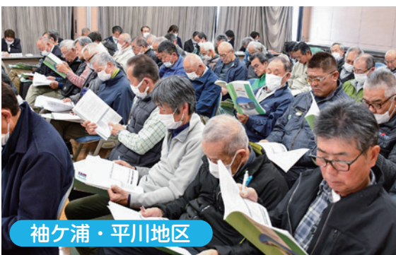
袖ヶ浦・平川地区