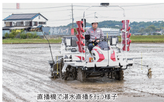
直播機で湛水直播を行う様子

「一人がいなければ農産物生産できない。農家として成長するには多くの経験と時間が必要。地域の担い手を、時間をかけて育てていきたい」と語る。