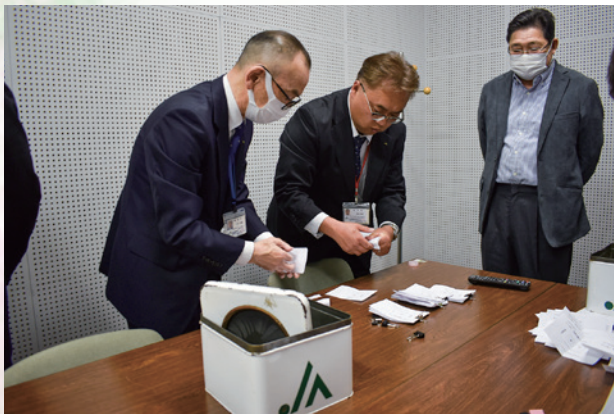
開票する職員と立会人のみなさん