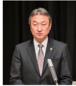
富津市長 高橋 恭市 様