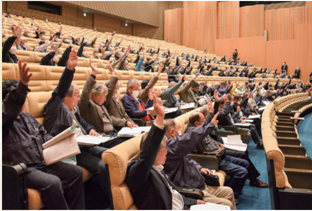
挙手による採決を行いました