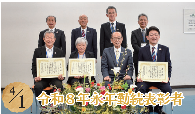
4/1 令和8年永年勤続表彰者